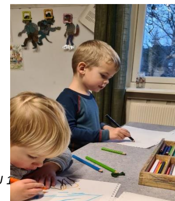
Godkjent at SU 1