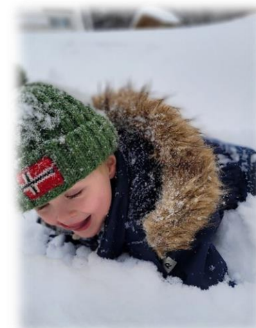
Godkjent at SU 18.04-2023