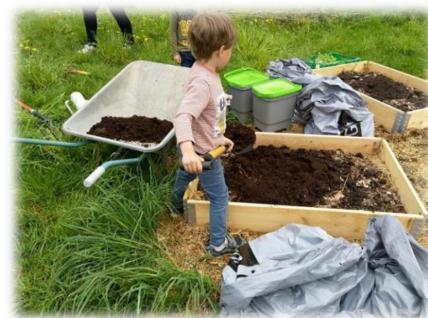
Godkjent at SU 18.04-2023